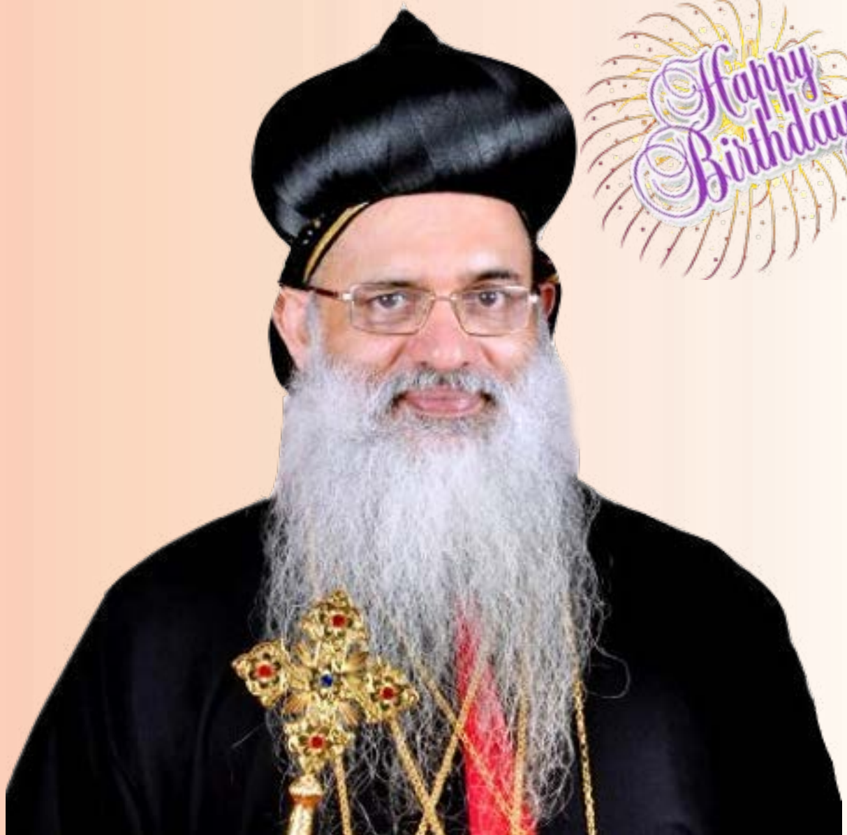
HIS HOLINESS MORAN MAR BASELIOS MARTHOMA PAULOSE II The Catholicose & Malankara Metropolitan