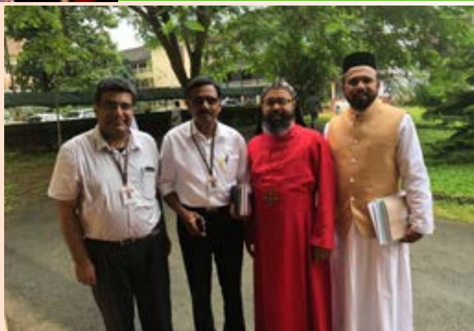
Managing Committee Meet at Kottayam