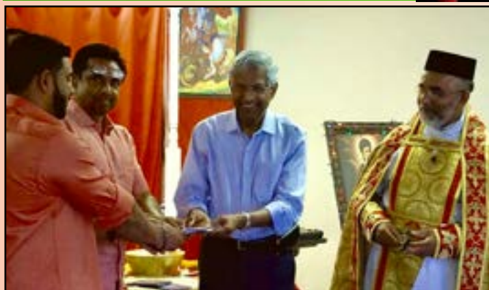
Building fund raiser kicked off at St Gregorios Indian Orthodox Church Atlanta