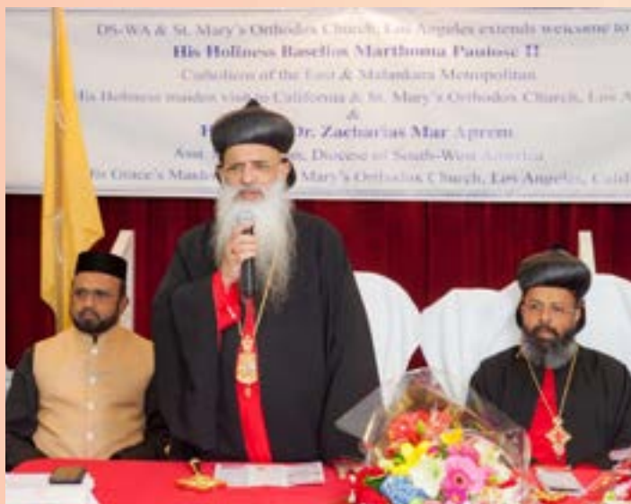
MGOC SM Florida Regional Retreat